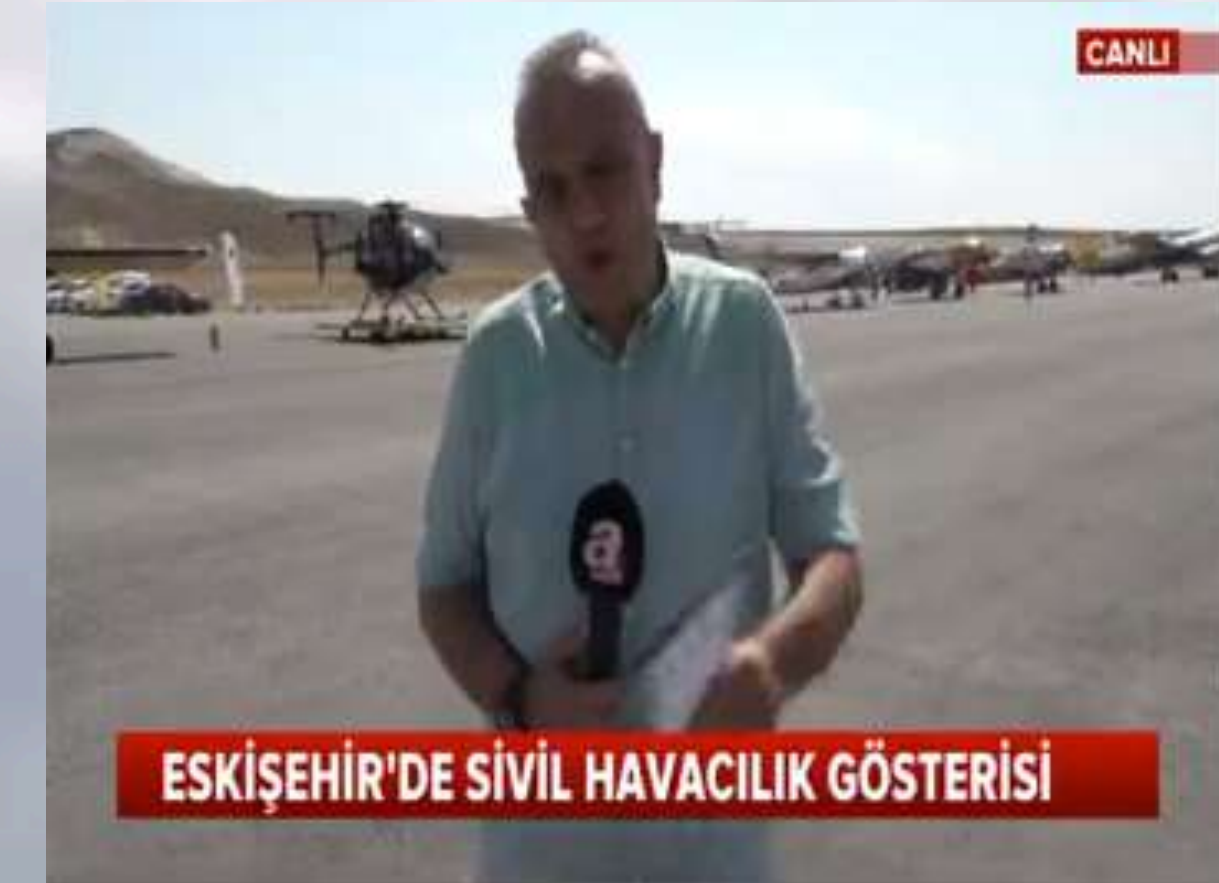
A Haber CANLI