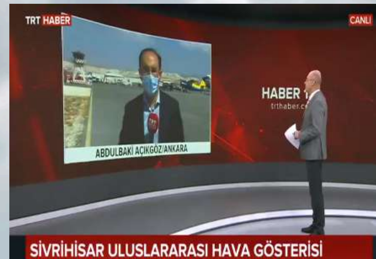
TRT Haber CANLI