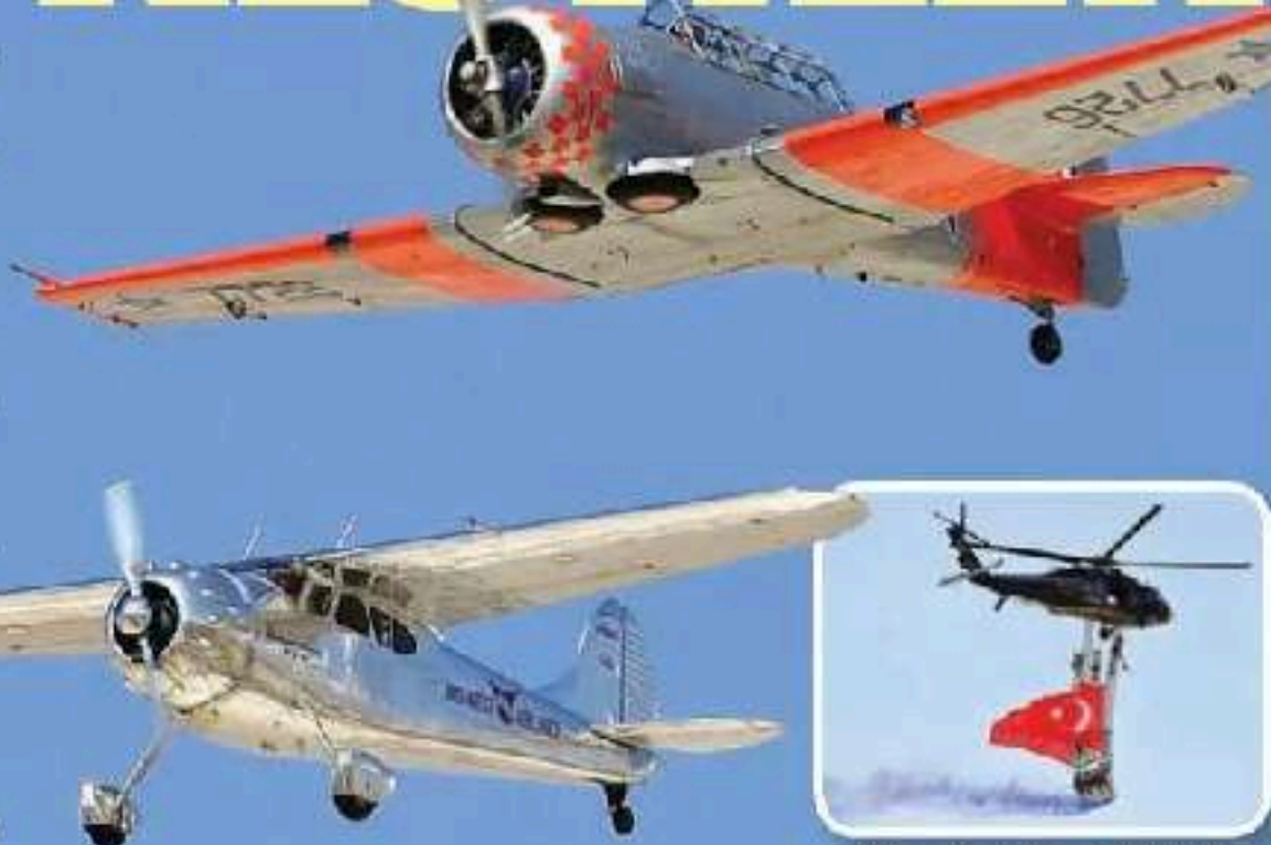
Sikorsky gösterisi büyük beğeni topladı.