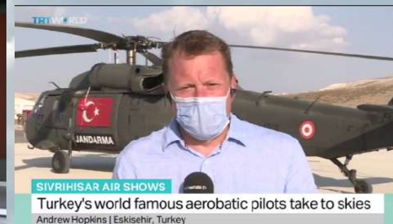
TRT World CANLI