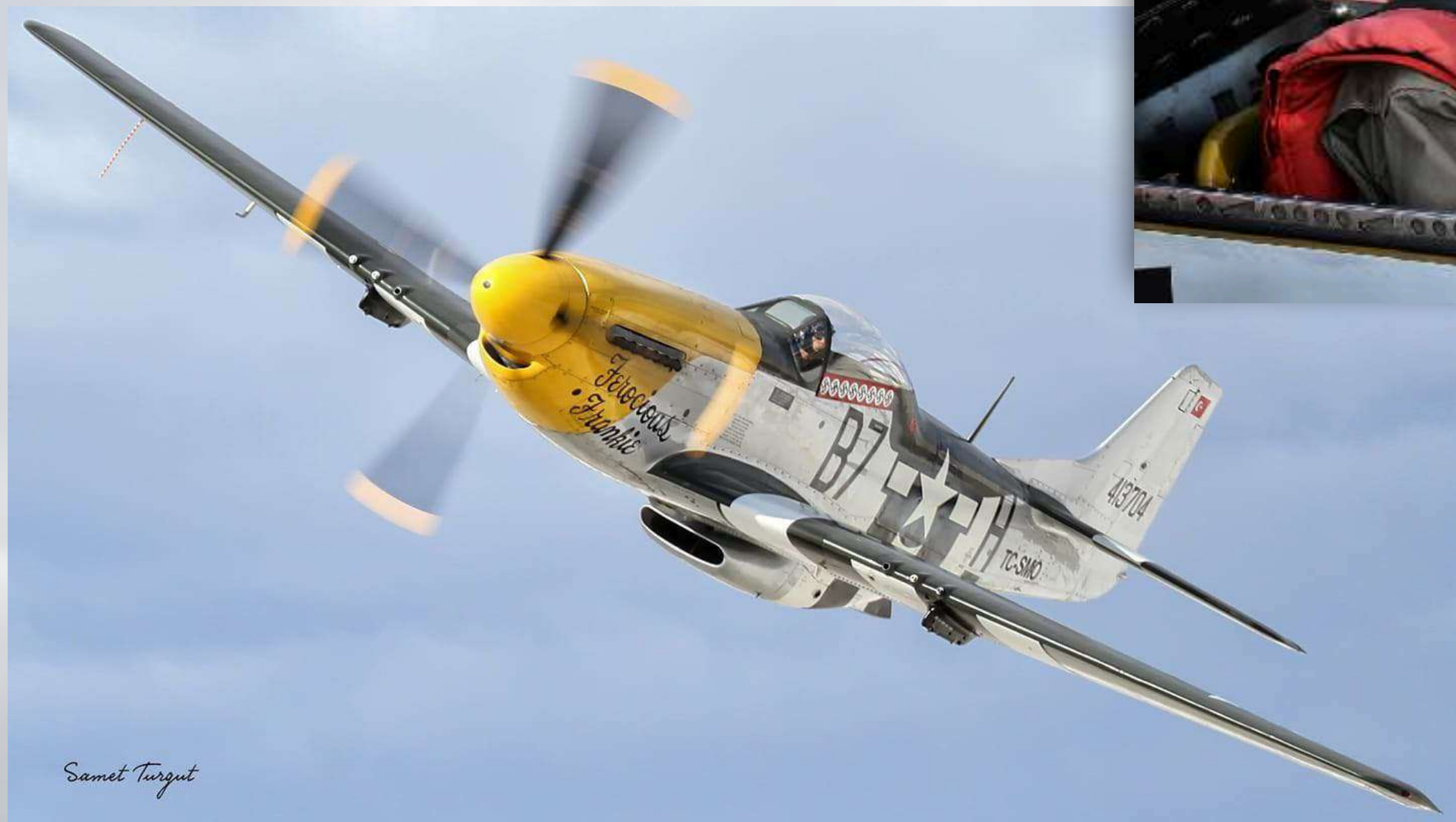
MUSTANG P-51 D "Ferocious Frankie"