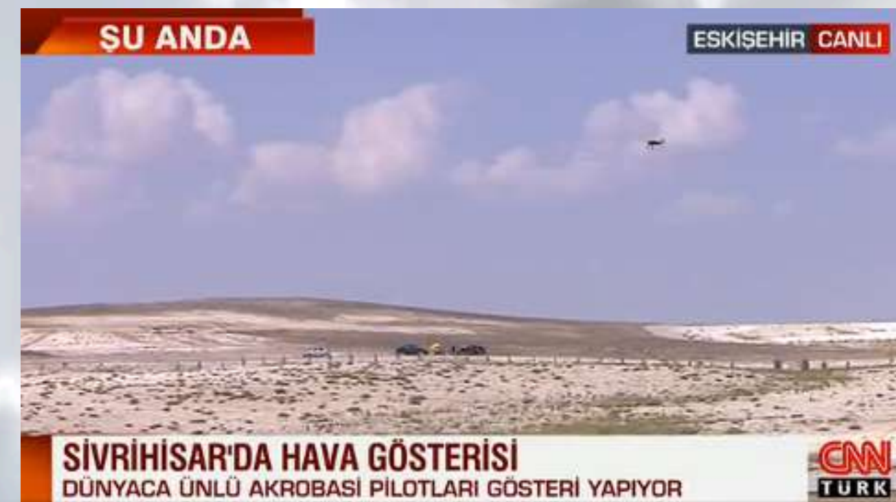
CNN TÜRK CANLI